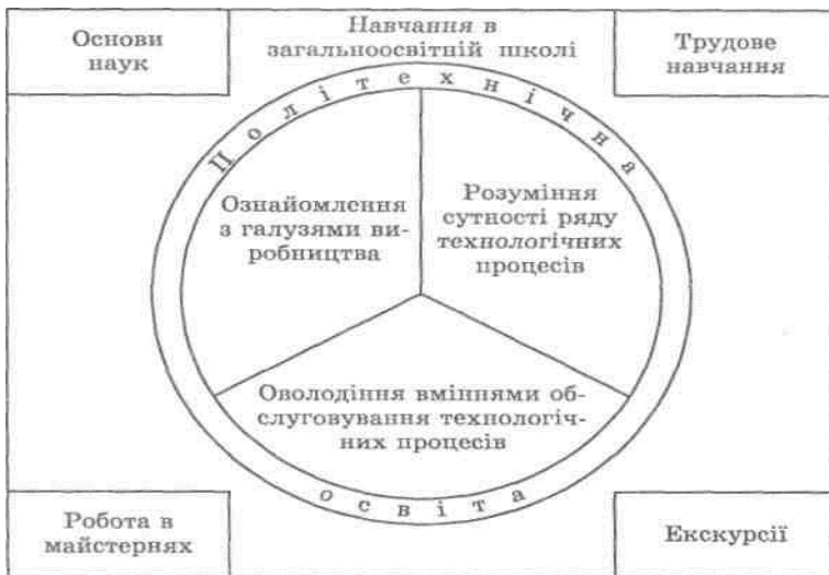
Рис. Структура політехнічної освіти

Професійна освіта спрямована на оволодіння знаннями, уміннями і навичками, що необхідні для виконання завдань професійної діяльності. Професійну освіту людина здобуває у спеціальних навчальних закладах (професійно-технічних училищах, інститутах, університетах, академіях).